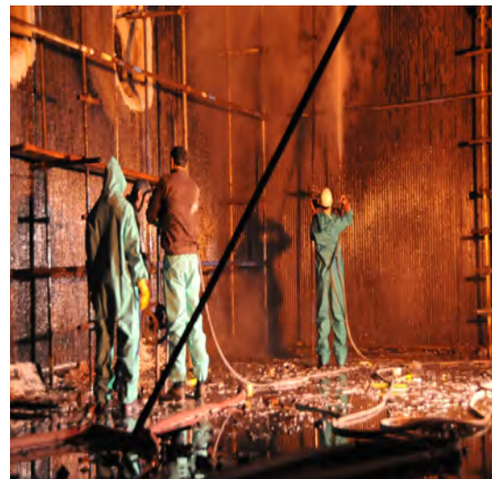
شکل (۵): عملیات قلیا شویی بویلر واحد ۳

[2]. R.D. Port and H.M. Herro, "The NALCO Guide to Boiler Failure Analysis." ,1991.