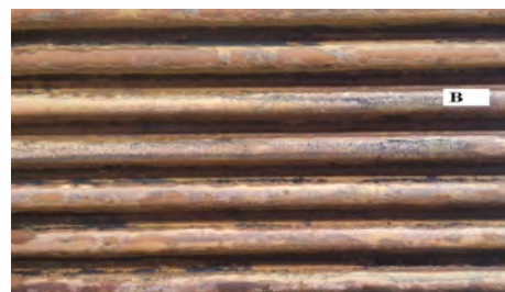
شکل (۱): لوله های بویلر قبل (A) و بعد (B) از عملیات قلیا شویی