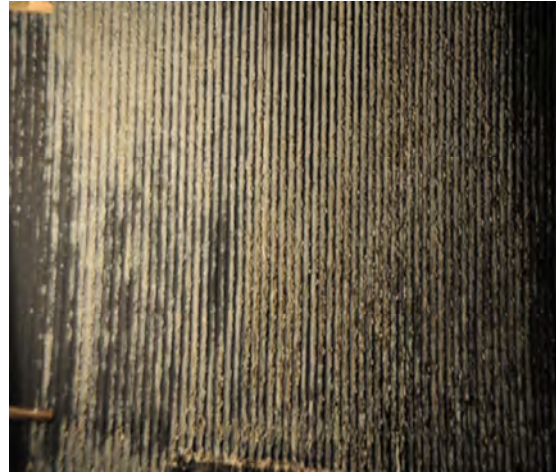
شکل (۳): دیواره بویلر واحد ۳ قبل از عملیات قلیا شویی