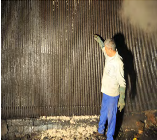
شکل (۶): دیواره بویلر واحد ۳ بعد از عملیات قلیا شویی