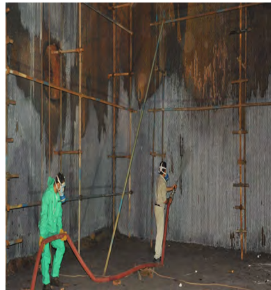
شکل (۴): عملیات قلیا شویی بویلر واحد ۳

قلیا شویی سطح لوله ها نیز روش موثر دیگری است که علاوه بر مقرون به صرفه بودن راندمان خوبی نیز در حذف رسوبات دارد. سطوح خارجی لوله های بویلر، سوپرهیتر، اکونومایزر و سطوح انتقال حرارت در پیش گرمکنهای هوا و محفظه احتراق کوره که عمل احتراق در آن انجام شده و یا مستقیماً با دود و گاز حاصل از عمل احتراق در تماس می باشند بدلیل چسبیدن و رسوب کردن برخی از مواد روی این سطوح بطور متناوب باید از این ذرات و رسوبات پاکسازی گردد تا عمل انتقال حرارت به نحو مناسب انجام شود و خوردگی لوله ها و سطوح به حداقل برسد. عمل پاکسازی معمولاً بوسیله شستشو با جریان آب پرفشار انجام می گیرد. اگرچه ممکن است در برخی موارد که رسوبات و ذرات خاصیت اسیدی شدید داشته باشند مواد قلیایی نیز به آب افزوده گردد.